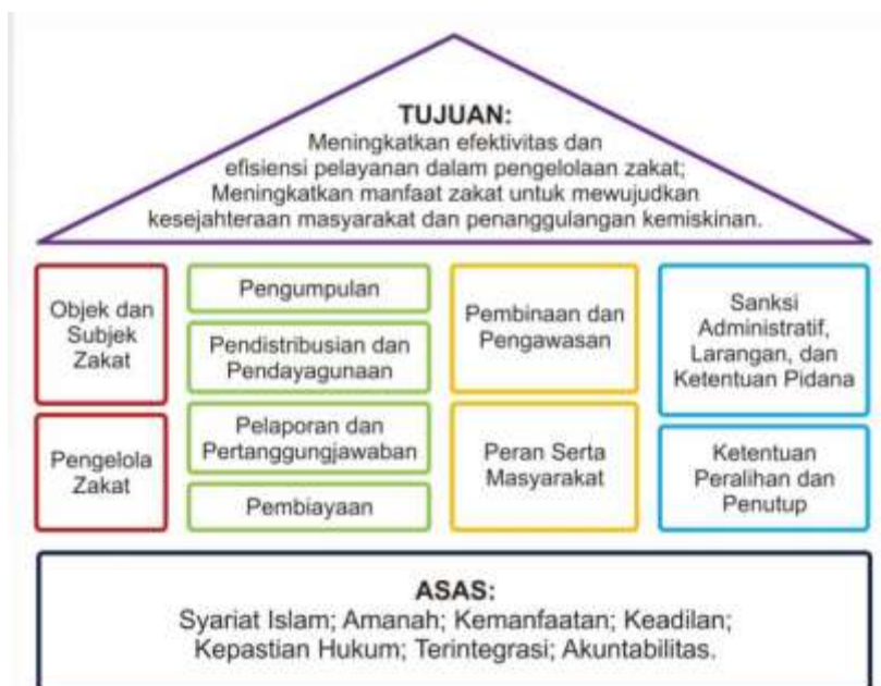
Gambar 1. Tujuan Baznas dalam pengelolaan Zakat

pengelolaan zakatnya, sehingga pengurusan atau pengelolaan zakat dapat berjalan secara efektif dan efisien, akhirnya dapat mendayagunakan fungsi zakat sebagaimana mestinya, yaitu memberantas kemiskinan. Dengan kata lain, lembaga-lembaga pengelola zakat dituntut merancang program secara terencana dan terukur.